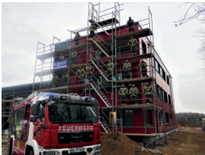
Gemeindeführer Marco Dorwo und eine Vielzahl von Trappenkammer Feuerwehrleuten nutzen die einmalige Möglichkeit, für ein Erinnerungsfoto in der noch stehenden Baugerüstanlage. Text/Foto: W. Stöwer

Seit der feierlichen Grundsteinlegung für das neue Feuerwehrgebäude der Gemeinde Trappenkamp, im März 2020, hat sich sehr viel getan am und im Neubau. „Meine Kameraden*innen und ich freuen uns auf den Umzug in diesen mo-