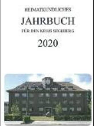
Die Titelseite des Heimatkundlichen Jahrbuches 2020 des Heimatverein Kreis Segeberg.

Oder beim Leiter der Günnebeker Plattsnacker, Werner Stöwer, Telefon 04323-2849